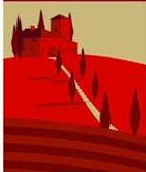
© ILLUSTRATION : JACQUES LAFITE, À PROPOSER/ÉDITEUR/ÉDITEUR